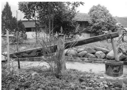
1. ábra. Vízrel hajtott rizshántoló mozsár

Bevezetés. Vietnamban a legtöbb embernek a rizs a fő tápláléka. A fehér rizst úgy készítik a hántolatlan rizsből, hogy hántolják, vagyis egy réteget eltávolítanak a rizsszemek felületéről. Észak-Vietnam hegyvidékei vízben gazdagok, és az ott élő emberek vízzel hajtott rizshántoló mozsarakat használnak ehhez a munkához. Az 1. ábra egy ilyen mozsarat mutat, a 2. ábrán pedig az látható, hogyan működik.